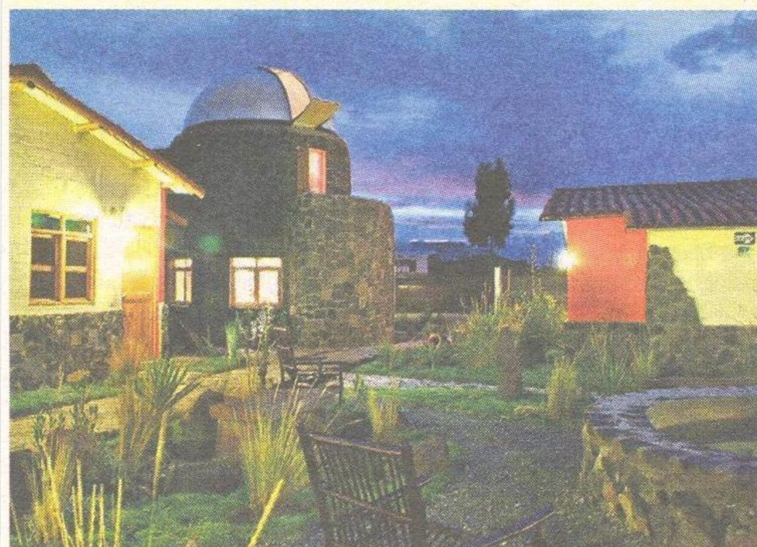
NOCTURNO. El planetario muestra el maravilloso cielo del valle.