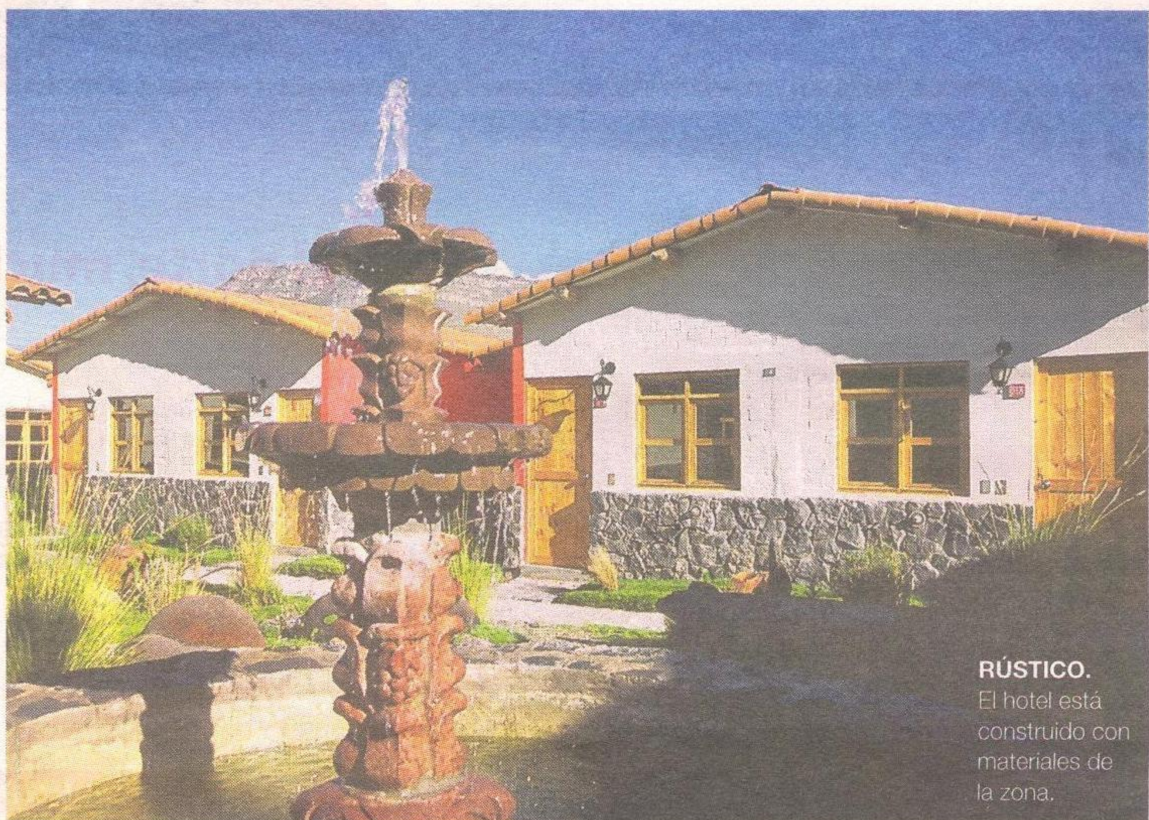
RÚSTICO. El hotel está construido con materiales de la zona.

El planetario y el observatorio lo sumergirán en el fascinante universo de las estrellas