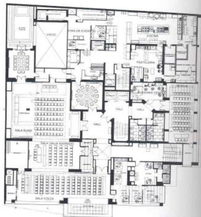
Planta segundo piso.