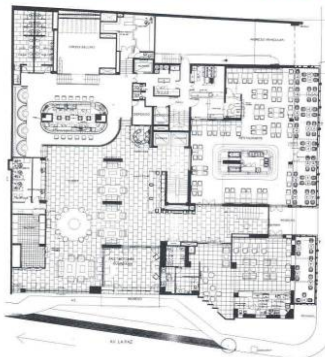
Planta primer piso.